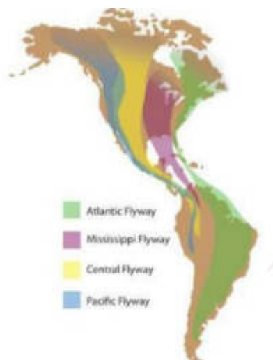
Figure 2 : Les voies de migration américaines

Les populations de limicoles que l'on retrouve en Guadeloupe sont migratrices pour la plupart et appartiennent à la « voie de migration ouest-atlantique », laquelle inclut notamment les populations canadiennes et américaines de ces espèces.